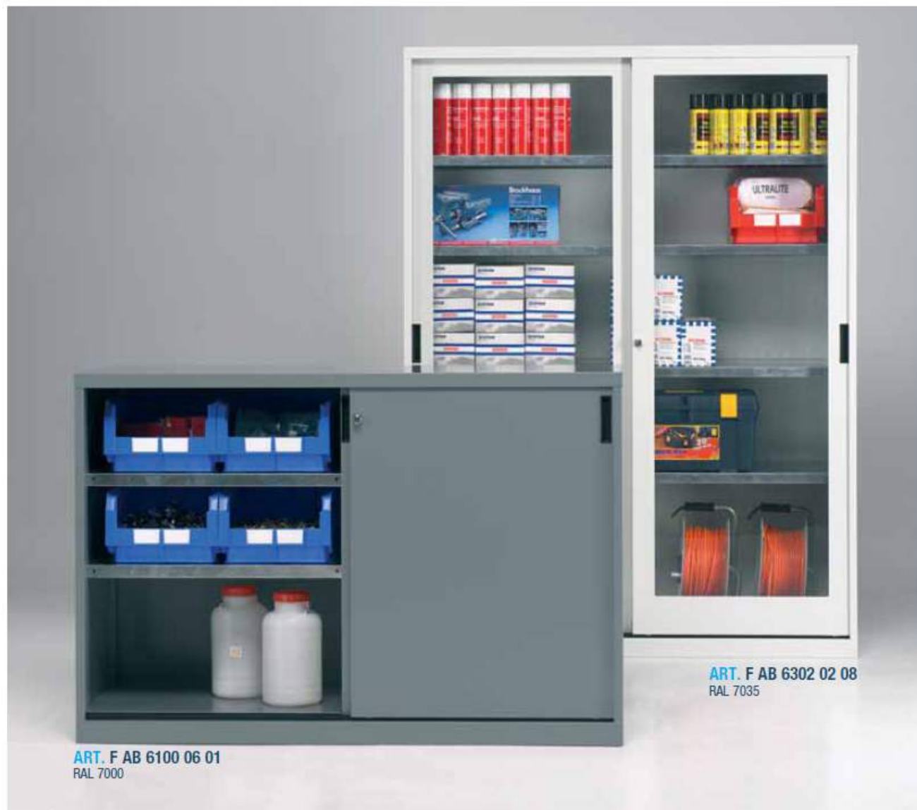
ART. F AB 6100 06 01 RAL 7000